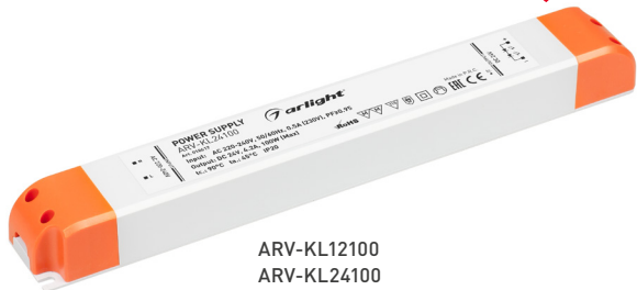
ARV-KL12100 ARV-KL24100 ARV-24100-SLIM-PFC