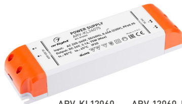
ARV-KL12060 ARV-12060-PFC ARV-KL24060 ARV-24060-PFC ARV-KL12075 ARV-12075-PFC ARV-KL24075 ARV-24075-PFC