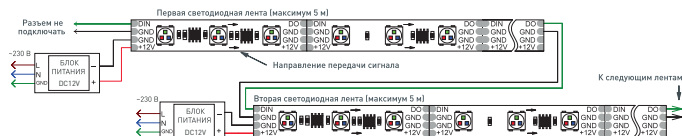
Рис. 1. Схема подключения ленты без использования внешнего контроллера (максимум 1024 пикселя, общий рисунок динамического эффекта при переходе с ленты на ленту сохраняется).