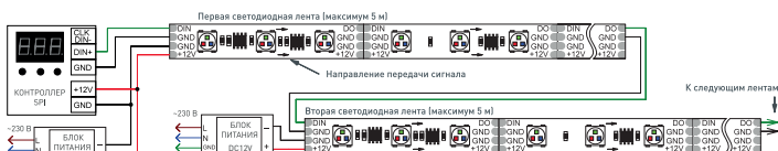
Рис. 2. Схема подключения ленты при управлении от внешнего контроллера.